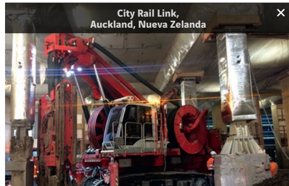
City Rail Link, Auckland, Nueva Zelanda